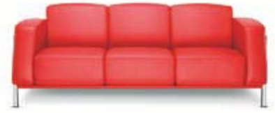
Dreier-Sofa Classic Classic 3-seater sofa