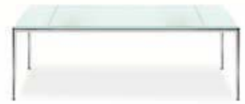
Classic Tisch 60×120 Classic coffee table 60×120