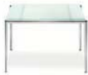
Classic Tisch 60×60 Classic coffee table 60×60