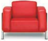
Sessel Classic Classic armchair