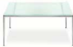
Classic Tisch 90×90 Classic coffee table 90×90