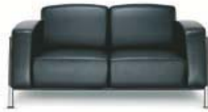
Zweier-Sofa Classic Classic 2-seater sofa